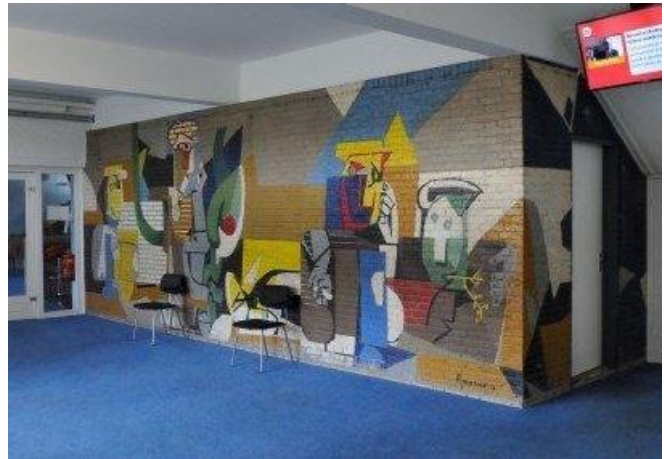
Wandschildering Pierre van Soest

Afgelopen zomer bereikte ons het treurige bericht dat de kleine Rietschuur van architect Frank van Klingereren in Diemen gesloopt was. Het diende als bijgebouw naast de Grote Rietschuur en is als ensemble ontworpen. De kleine rietschuur stond leeg en moest van de eigenaar, de gemeente Diemen, vanwege bouwvalligheid plaatsmaken voor de nieuwbouw van een school. Helaas heeft de gemeente Diemen meermaals pleidooien voor behoud genegeerd. Bond Heemschut Noord-Holland en de Historische Vereniging Diemen zetten zich nu in om de Grote Rietschuur wel beschermd te krijgen.